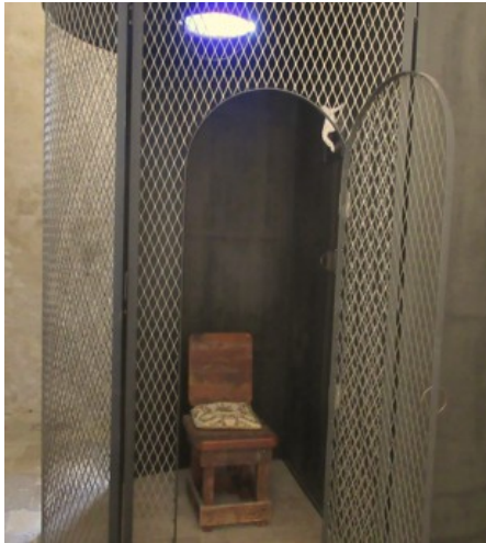
une lampe bleue