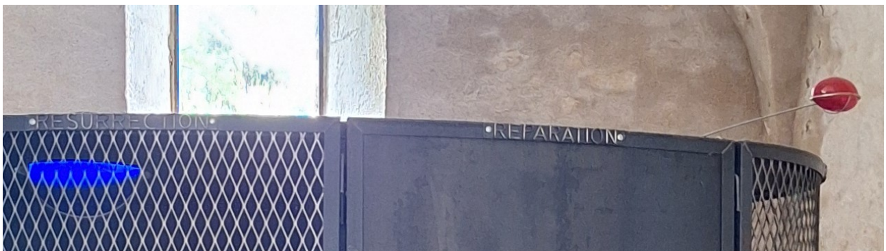
une lampe rouge = le cœur

En haut du confessionnal : il est écrit RÉSURRECTION , RÉPARATION + une petite lampe rouge qui, éclairée, indique une présence