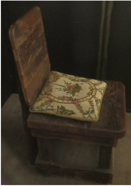
Les coussins sont réalisés avec des fragments de tapisseries issues de l'atelier familial