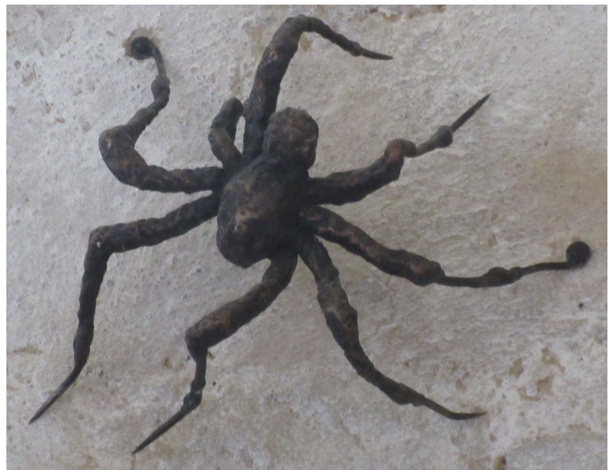
Figure de la mère de Louise BOURGEOIS, qui fut tisserande, elle est accrochée au mur dans la chapelle