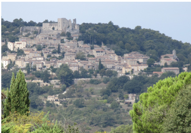
,,, et Lacoste , avec le château du Marquis de SADE