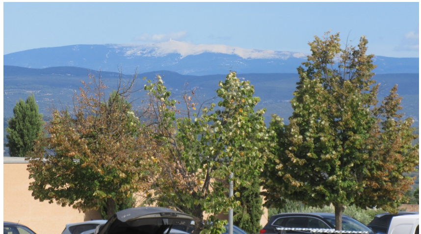
Au loin,,, le Mont Ventoux